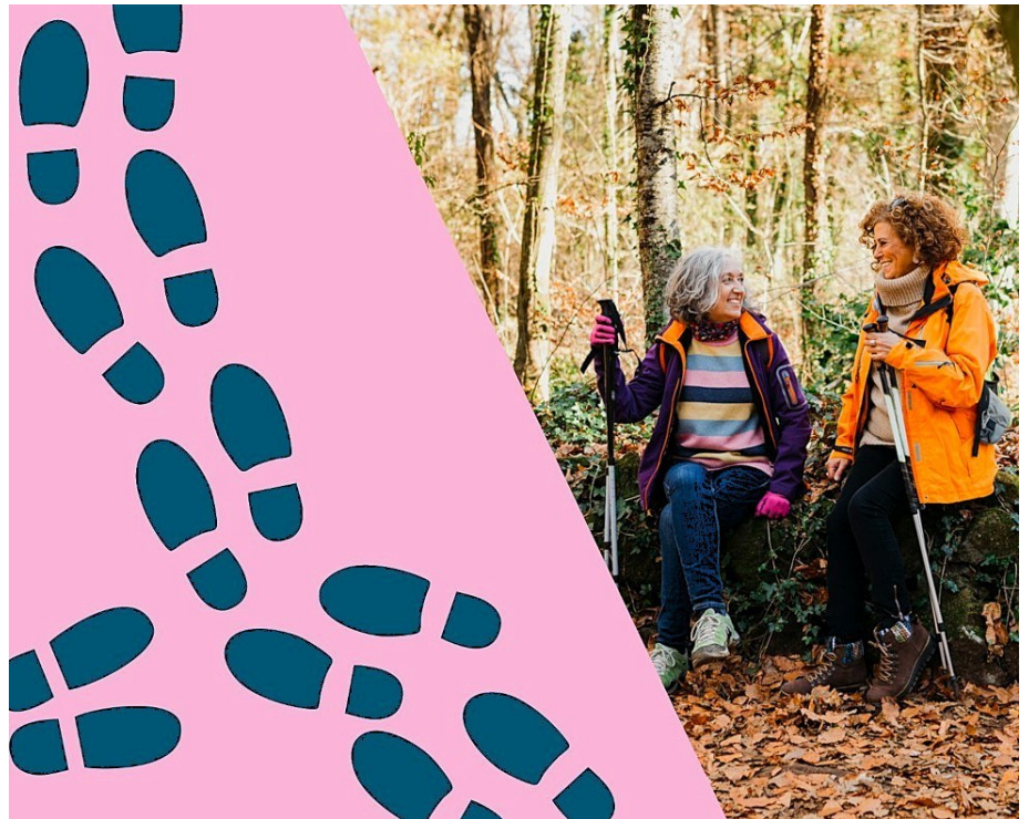
Bewegungsstadium: Die Pro Senectute vermittelt Seniorinnen und Senioren individuelle Begleitpersonen für eine gemeinsame Freizeit.

Die Rückmeldungen aus den Bewegungspatenenschaften zeigen der Pro Senectute: Das wöchentliche Treffen wird zu einem